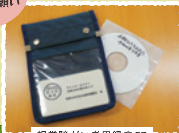
視覚障がい者用録音CD

常陸太田市社協は茨城県で1番最初に認可された視覚障がい者用録音発受施設なんだよ!