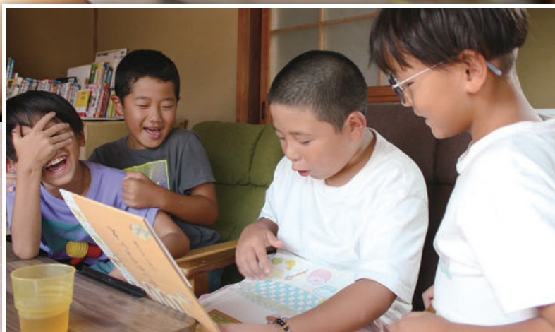
表紙：のこのこ村にあふれる笑顔 (P2-3)