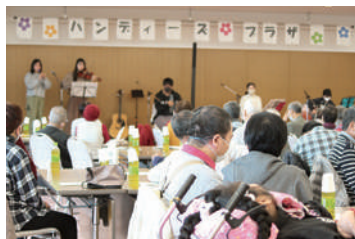
ハンディーズプラザの開催