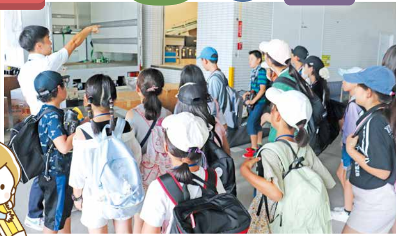
日本赤十字社兵庫県支部見学