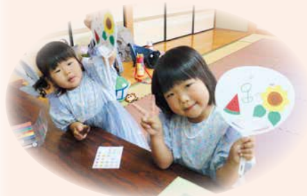
子どもたちのために…