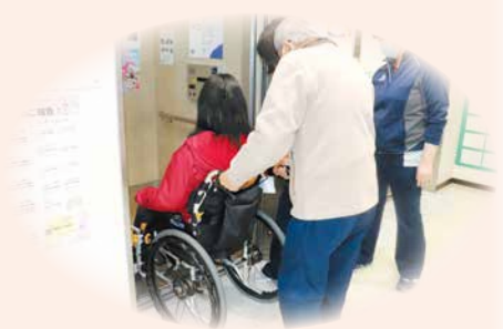
地域の福祉のために…