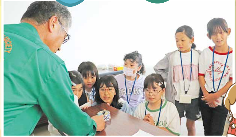
ツナ缶でランプを作ろう！