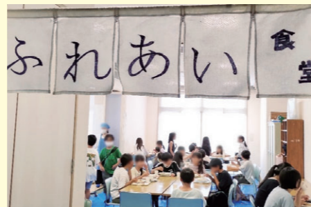
素敵なのれんがお出迎え