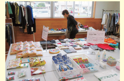
食品や衣類が数多く並びます