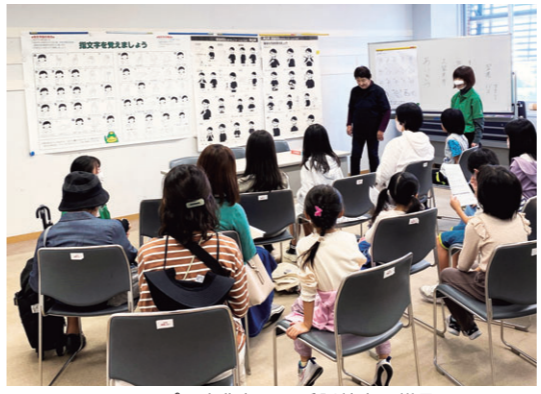
えーるピア文化祭での手話教室の様子

聴覚障害者への理解や、手話の普及と啓発のための活動、および手話通訳者の派遣など幅広く行う団体です。