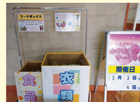
コミュニティセンターにボックスが常設されています

ゆずりあいマーケットがあるからと、今までコミュニティセンターに足を運ぶ機会のなかった人が訪れるきっかけにもなっています。