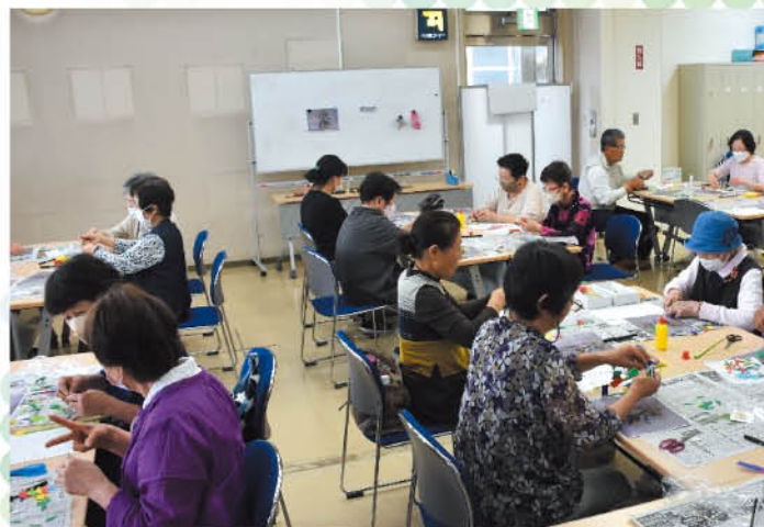
いきいきサロンリーダー会「簡単クラフト」