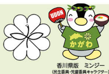
香川県版 ミンジー (民生委員・児童委員キャラクター)

※民生委員・児童委員、主任児童委員を知っていただくため、各地区で「民生委員・児童委員の日」の活動に取り組んでいます。 (令和6年5月の各地区活動状況)