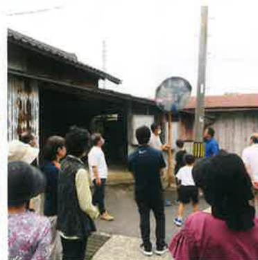
まち歩きの様子 (向原集落)