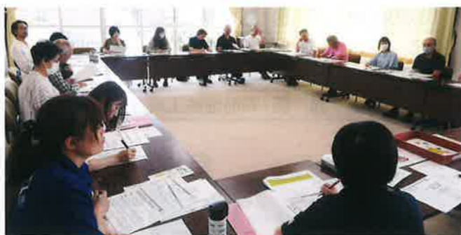
「ゆるっと琴浦」の様子

* 「ゆるっと琴浦」とは、誰でも住み慣れた地域で安心して暮らし続けるために必要な支援体制の充実・強化を図るための話し合いの場のことです。