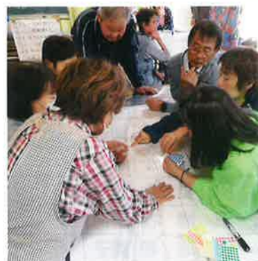
支え愛マップ作りの様子 (宮木集落)

社協では、災害発生を想定した話し合いを普段からの声掛けや見守りなどの支え合いを考えるきっかけにもらうため、支え愛マップの取組を推進しています。